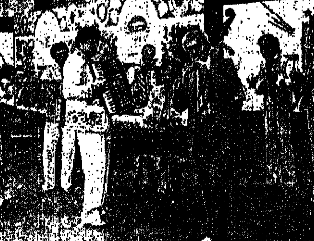
الفرلة الفنية لرايق لويبرير يورا